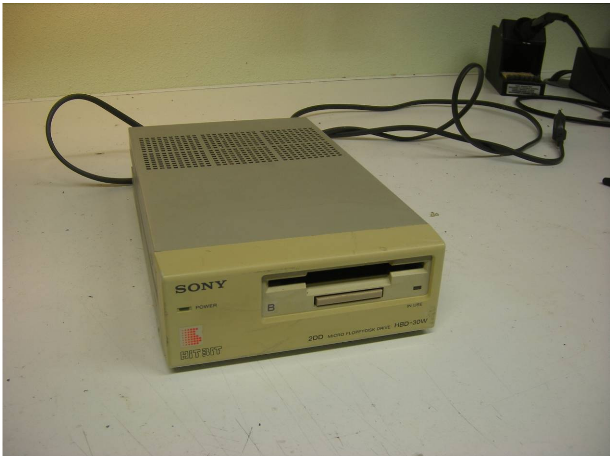
Sony HBD-30W met originele diskdrive

De diskdrive die je nodig hebt moet wel geschikt zijn voor het gebruik op een MSX-computer. Afhankelijk van de toepassing moet de drive wel ingesteld kunnen worden als A- of B-drive.