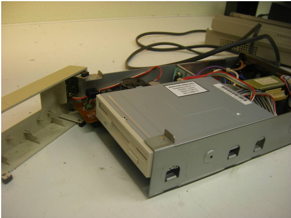
De nieuwe diskdrive gemonteerd op afstandsbussen