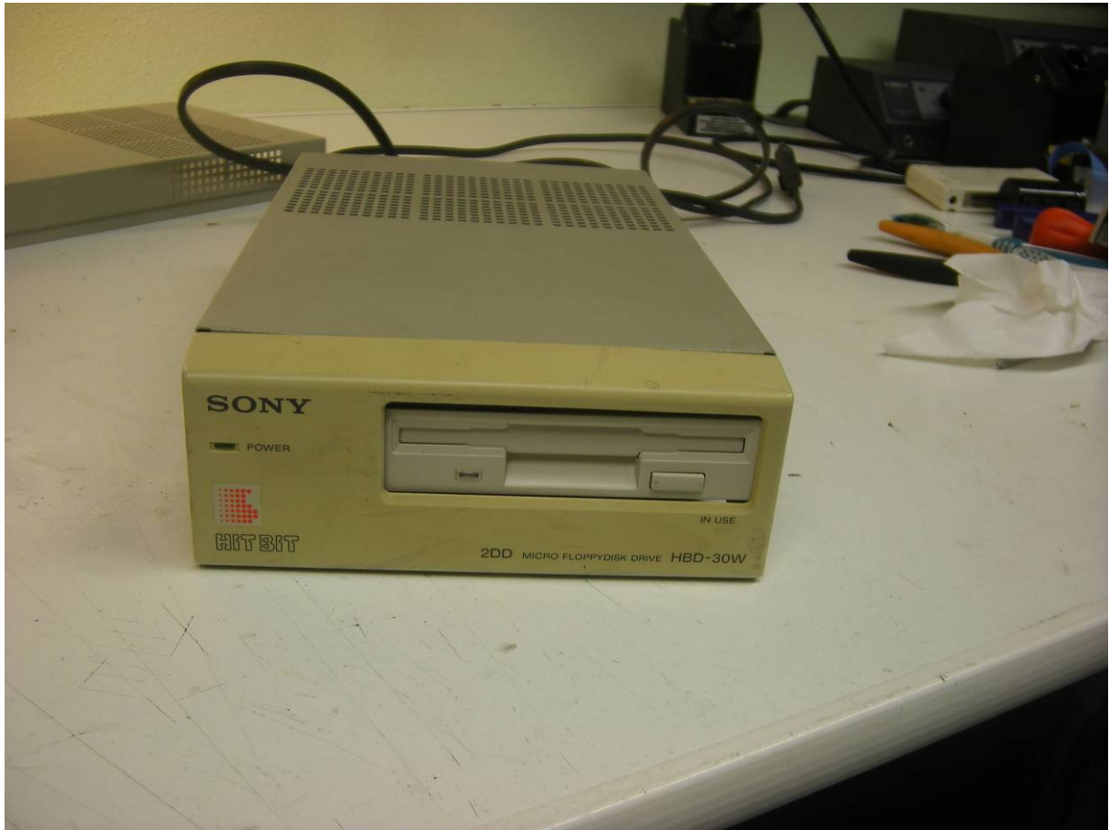
Sony HBD-30W met nieuwe diskdrive